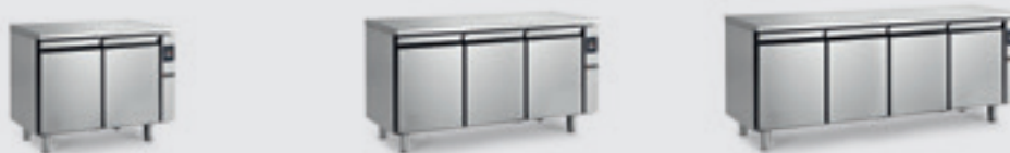
TNG7/100 TNGB7/100 TNG7/150 TNGB7/150 TNG7/200 TNGB7/200

TAVOLI REFRIGERATI/CONSERVATORI PREDISPOSTI GN 1/1 PROF. 700 - CORPO H 660 TABLES RÉFRIGÉRÉES/CONSERVATEURS PRÉDISPOSÉES GN 1/1 PROF. 700 - CORPS H 660 MESAS REFRIGERADAS/DE CONSERVACIÓN PREPARADAS GN 1/1 PROF. 700 - CUERPO H 660